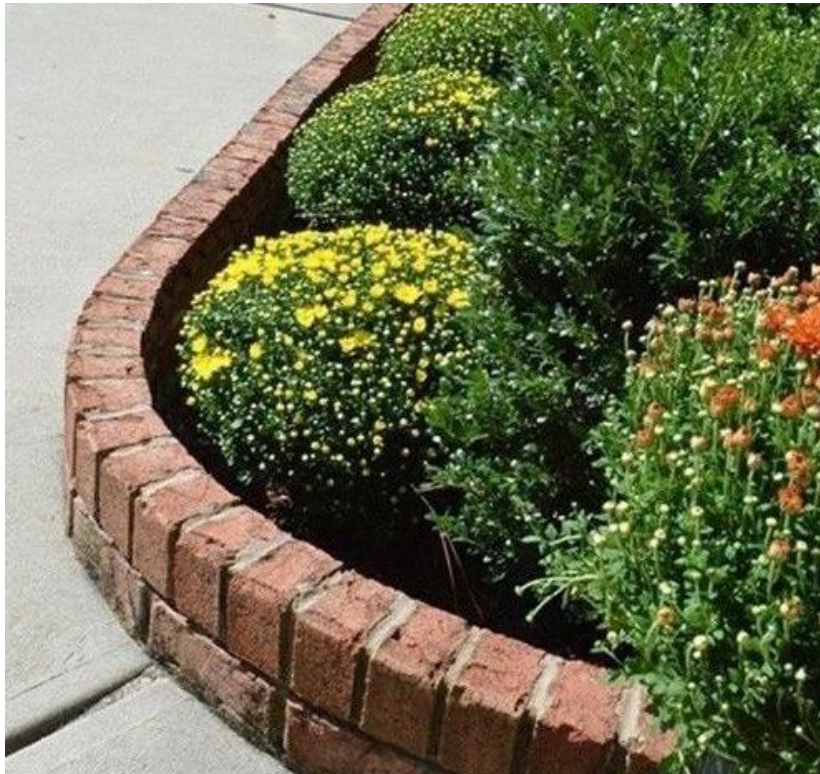
Gambar 4 Contoh pembuatan wall planter