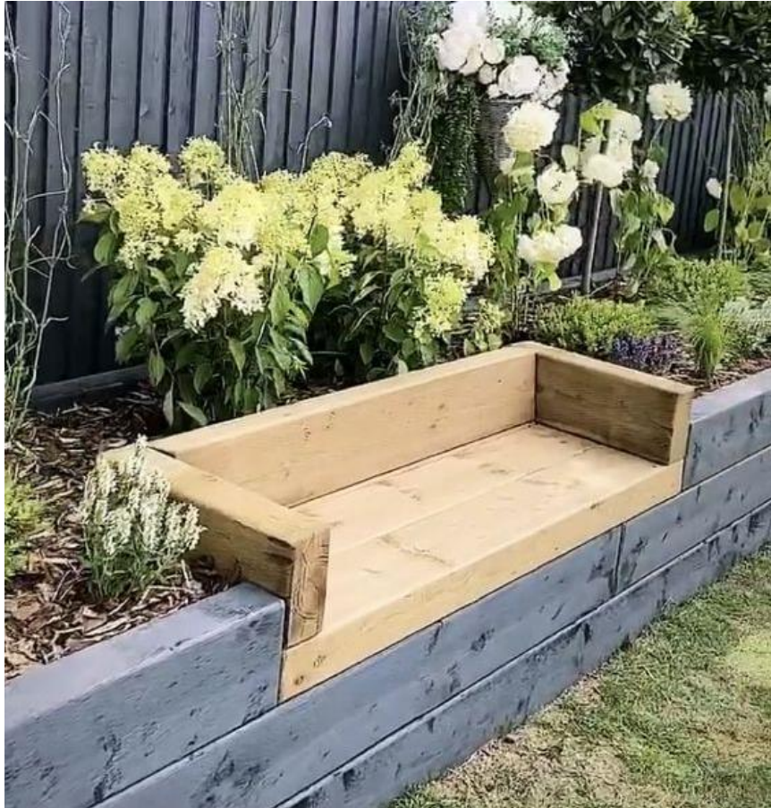
Gambar 4 Contoh pembuatan bench kayu