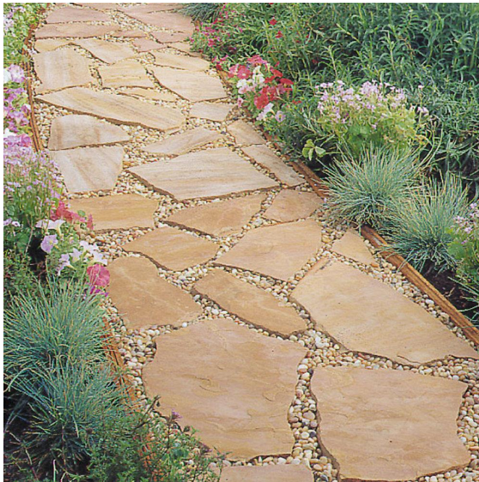
Gambar 2 Contoh pembuatan pavement