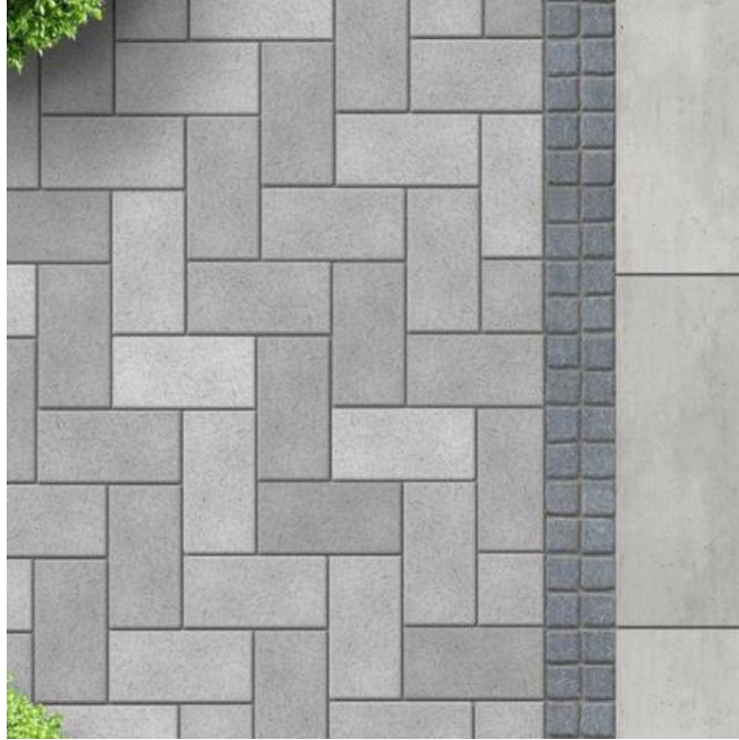
Gambar 3 Contoh pembuatan pavement

Keterampilan yang diharapkan dari kompetitor untuk membuat jalur jalan di dalam taman yang terukur dan menggunakan material yang ditentukan. Membuat Jalan Bata/Paving block dan atau dengan komposisi Batu Tabur