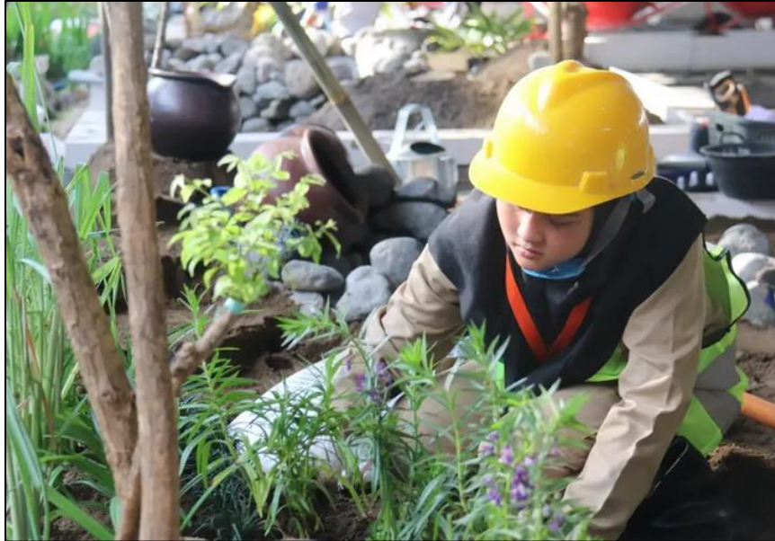
Gambar 1 Contoh penanaman dan mengkomposisikan tanaman