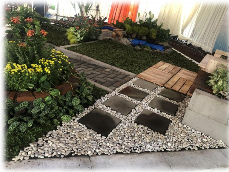
Gambar 3 Contoh pembuatan pavement

Keterampilan yang diharapkan dari kompetitor untuk membuat jalur jalan di dalam taman yang terukur dan menggunakan material yang ditentukan. Membuat Jalan Bata/ Paving block dan atau dengan komposisi Batu Tabur