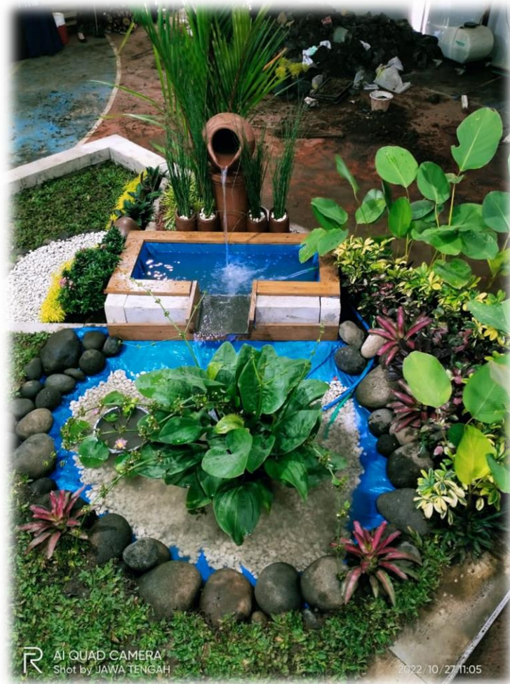
Gambar 5 Contoh pembuatan water feature