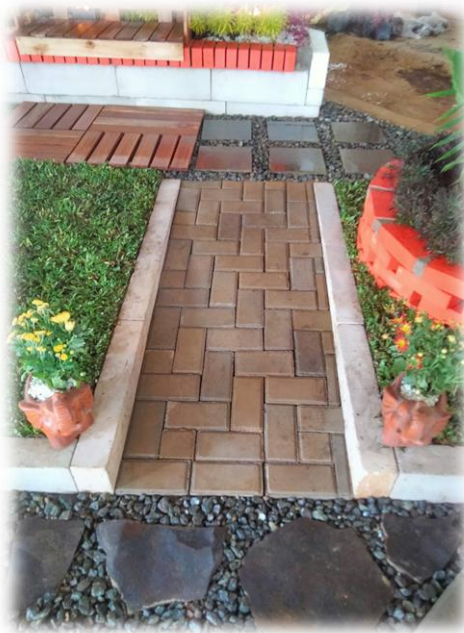
Gambar 2 Contoh pembuatan pavement