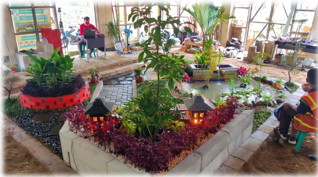
Gambar 4 Contoh pembuatan wall planter