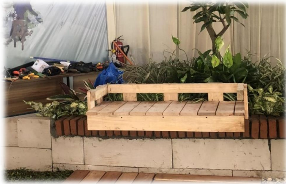
Gambar 6 Contoh pembuatan bench kayu