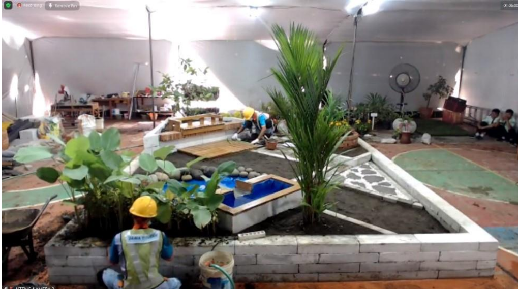
Gambar 1 Contoh penanaman dan mengkomposisikan tanaman

Kompetitor diharapkan mengetahui secara pertumbuhan dan pemeliharannya yang ramah lingkungan.